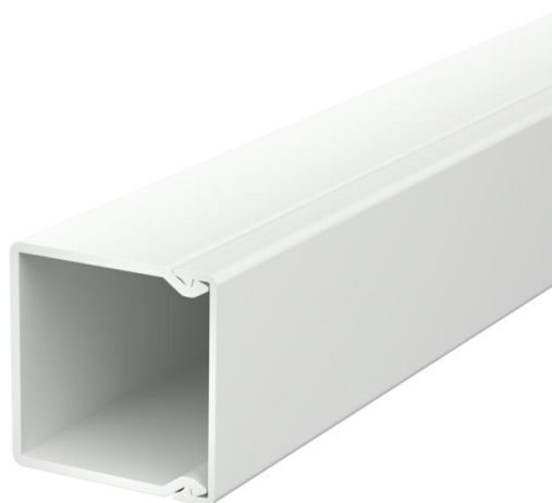
Elemento superiore e inferiore canale con foratura alla base