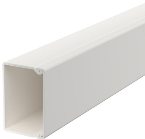
Elemento superiore e inferiore canale con foratura alla base