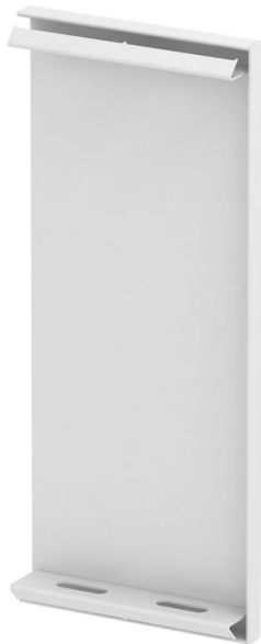
Endstück für GS Geräteeinbaukanal.