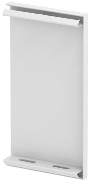
Endstück für GS Geräteeinbaukanal.