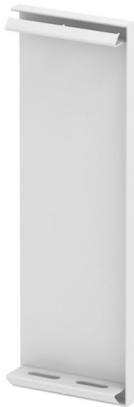
Endstück für GS Geräteeinbaukanal.