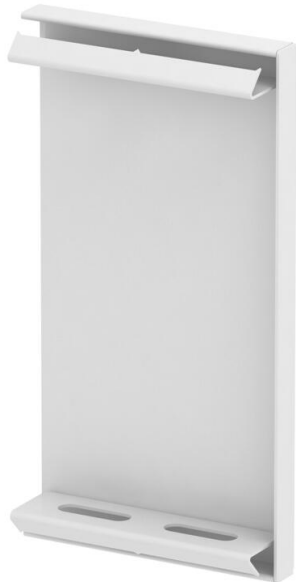
Endstück für GS Geräteeinbaukanal.