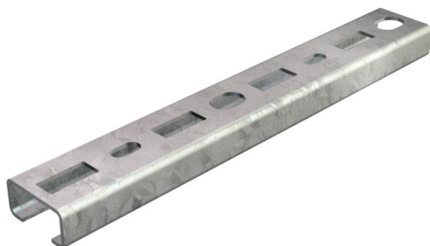
Rail profilé, perforé, ouverture 16 mm.