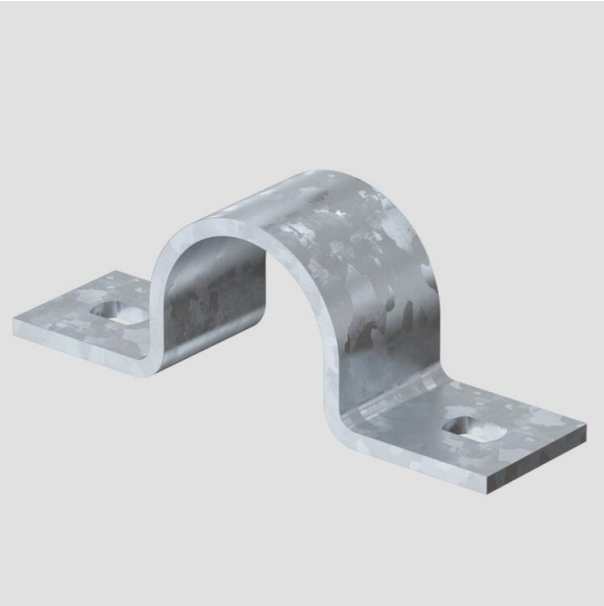
Collier de fixation avec deux pattes de fixation 32 mm