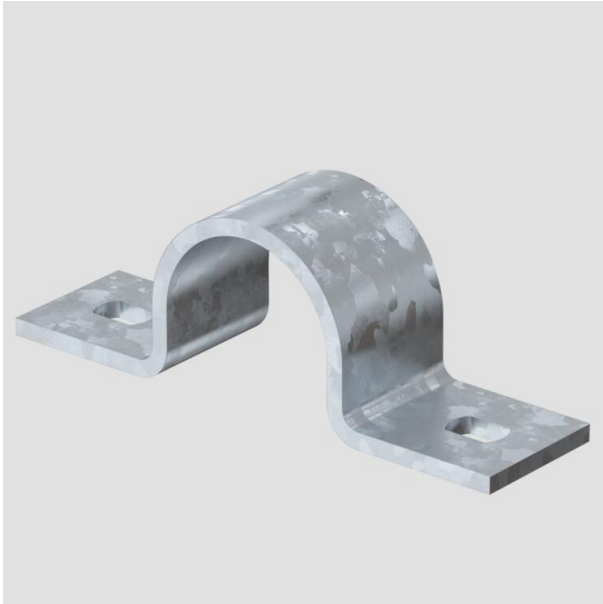
Befestigungsschelle zweilappig 32mm