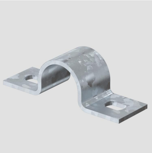
Collier de fixation avec deux pattes de fixation 20 mm