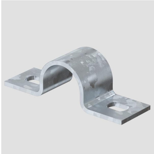
Befestigungsschelle zweilappig 20mm