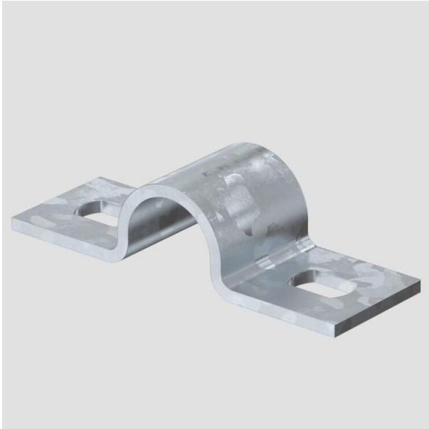
Befestigungsschelle zweilappig 16mm