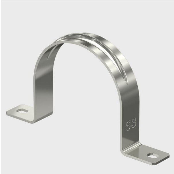
Zweilappige Befestigungsschelle für Kabel und Rohre