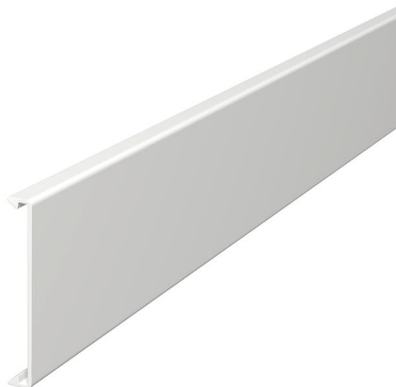
Couvercle pour l'obturation des goulottes.