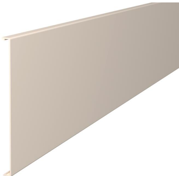
Couvercle pour l'obturation des goulottes.